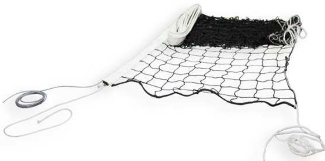
IMAGEN Y DIMENSIONES